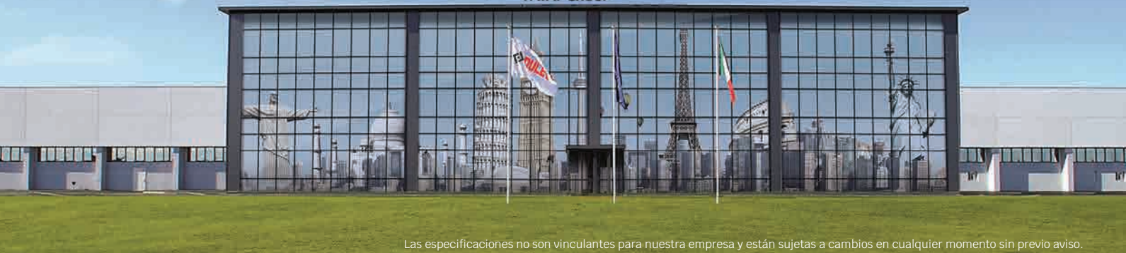
Las especificaciones no son vinculantes para nuestra empresa y están sujetas a cambios en cualquier momento sin previo aviso.