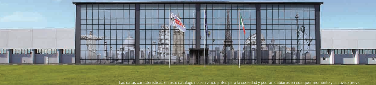
Las datas características en este catalogo no son vinculantes para la sociedad y podran cabiare en cualquier momento y sin aviso previo.