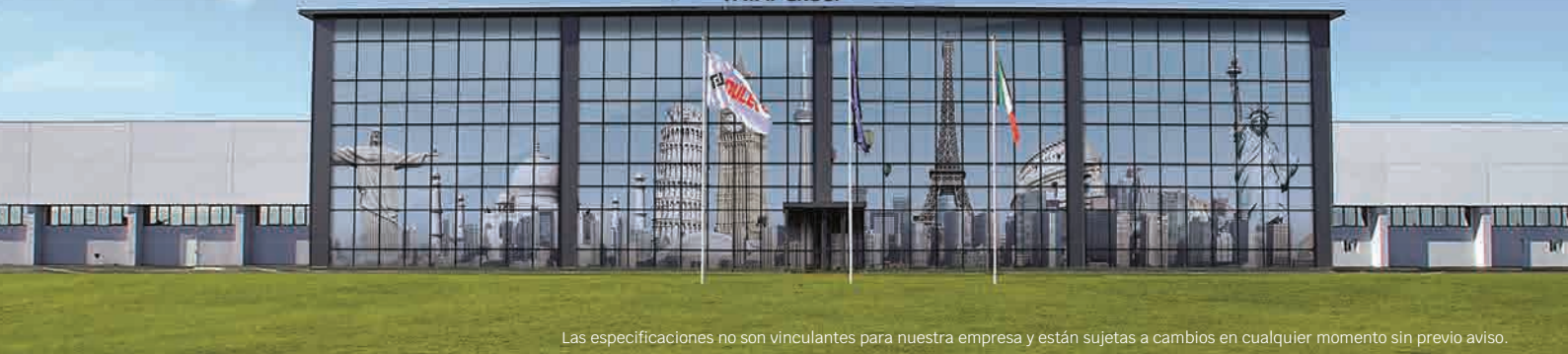
Las especificaciones no son vinculantes para nuestra empresa y están sujetas a cambios en cualquier momento sin previo aviso.